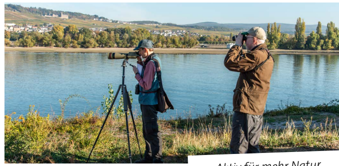
Aktiv für mehr Natur

Hessische Gesellschaft für Ornithologie und Naturschutz e. V. Lindenstraße 5 61209 Echzell